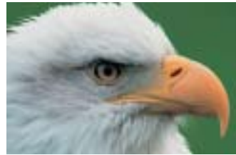
L'aigle avant outil correcteur