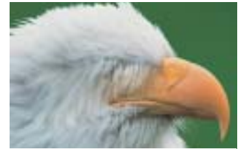
L'aigle après retouche !!

matières, couleurs... Photoshop est désormais fait pour la peinture ! Pour votre confort, nous vous conseillons une tablette graphique, telle que l'Intuos2 de Wacom.